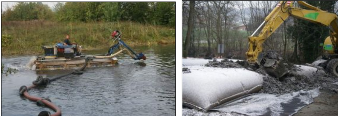
Abb. 3: Geotubes ( http://www.aquamarine-technologies.ch/geotube.html )

Mittels einer schwimmenden Ansaugpumpe auf einem Amphibienfahrzeug wird der Schlamm aus dem Gewässer in die Geotubes gepumpt (vgl. Abb. 3). Der Vorteil dabei ist, dass das Wasser nicht abgelassen werden muss. Das Wasser-Schlamm-Gemisch kann mit einem Flockungsmittel vermischt werden, durch das die spätere Entwässerung in den Geotubes erleichtert wird. Das Vollpumpen der Geotubes dauert mehrere Tage. Durch die porösen Hüllen läuft das Wasser zurück in das Gewässer. Zu diesem Zweck werden die Geotubes auf eine Folie mit Gefälle zum Gewässer gelagert. Nach der abschließenden Trocknungsphase (Tage bis Woche) werden die Säcke aufgerissen und das stichfeste Restmaterial kann mit dem Bagger auf Lkw geladen werden (vgl. Abb. 3).