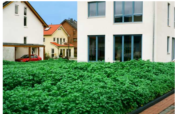
Regeneration baulich beanspruchter Gartenböden mit einer Zwischenbegrünung, hier Senf vor der Blüte.

Falls die Böden trotz aller Vorkehrungen verdichtet wurden, müssen sie fachgerecht bis in die Verdichtungszone gelockert werden. Auch bestehende Schäden aus Vornutzungen sollten gezielt beseitigt werden.